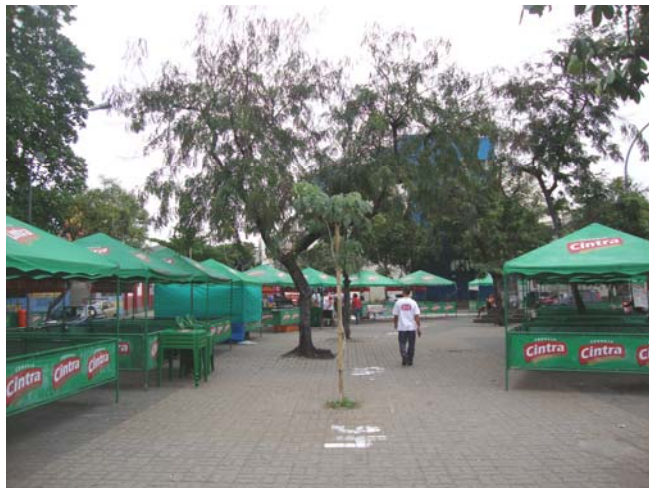
Figura 9: Barracas padronizadas Fonte: Autor, 2010.

As áreas peatonais do Largo da Penha [duas áreas cortadas pela Av. Brás de Pina] são o espaço coletivo mais adequado para apropriação com barracas, uma vez que são superfícies mais “limpas”, com poucos elementos construídos, e que, caso fosse interrompido o tráfego, poderiam conformar uma área mais contínua e fluida (fig. 10).